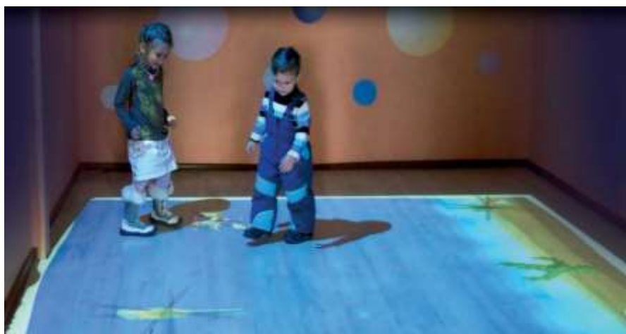
Пример интерактивного пола

Интерактивный стол. Данное средство является симбиозом интерактивной поверхности, экрана и классического стола и позволяет группе детей одновременно проводить игровые сеансы на одной поверхности. Дети совместно могут выполнять различные интерактивные задания, конструировать, рисовать, создавать собственные презентации. Специальное программное обеспечение позволяет загружать и наполнять собственным образовательным содержанием приложения интерактивного стола и, а также графику и видео. Интерактивный стол также подходит для детей с особыми потребностями для коррекционной работы.