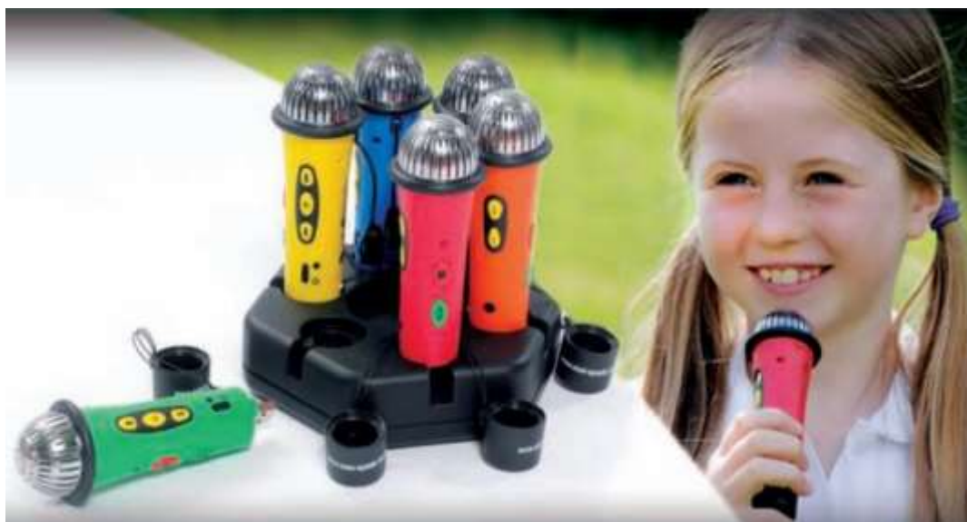
Пример комплекта микрофонов

Комплект из 6-ти микрофонов. Рекордер позволяет записывать голоса, звуки и даже музыку в любой момент игрового сеанса благодаря встроенной памяти и аккумулятору на 4 часа автономной работы. Игровое интерактивное средство изготовлено в виде классического микрофона, что положительно влияет на детей: они чувствуют себя настоящими репортерами, артистами или певцами. Весь записанный материал можно сохранить и воспроизводить. Комплект состоит из 6 микрофонов различного цвета и может доукомплектовываться мобильной станцией воспроизведения записанного материала с микрофонов.