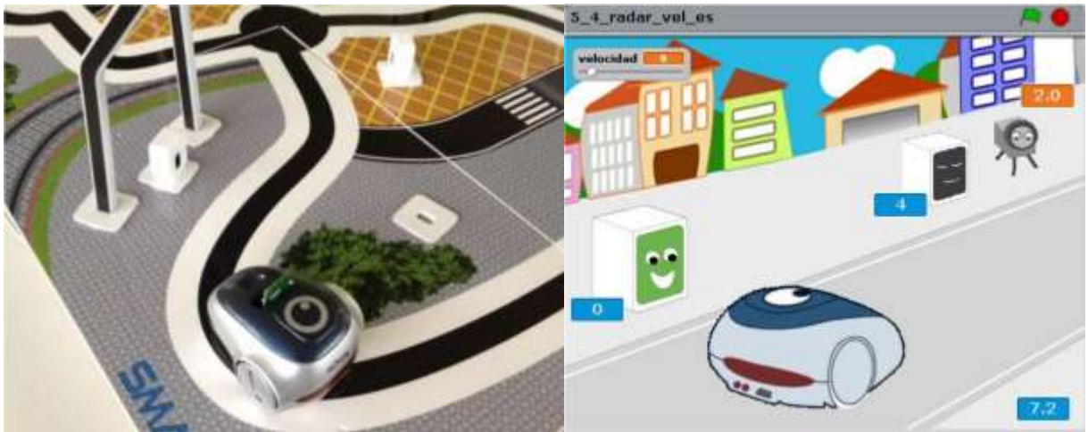
Комплекс Moway+Scratch (Робототехника)

Соблюдение техники безопасности и использование здоровьесберегающих технологий. При работе компьютеров и интерактивного оборудования в помещении создаются специфические условия: уменьшаются влажность, повышается температура воздуха, увеличивается количество тяжелых ионов, возрастает электростатическое напряжение в зоне рук детей. Напряженность электростатического поля усиливается при отделке кабинета полимерными материалами. Пол должен иметь антистатическое покрытие, а использование ковров и ковровых изделий не допускается.