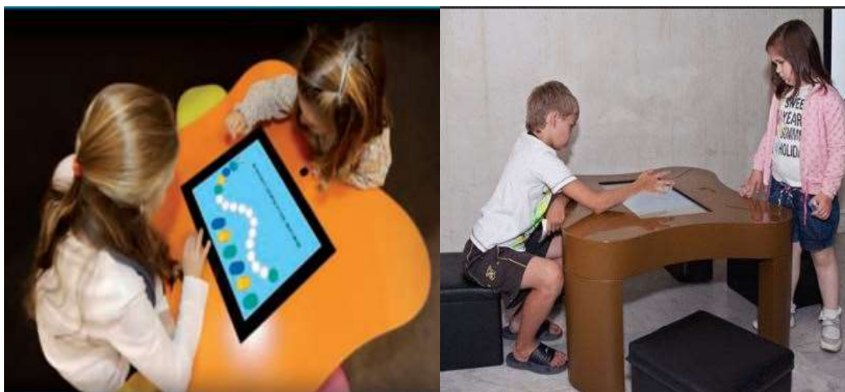
Примеры интерактивного стола

Интерактивный стол. Данное средство является симбиозом интерактивной поверхности, экрана и классического стола и позволяет группе детей одновременно проводить игровые сеансы на одной поверхности. Дети совместно могут выполнять различные интерактивные задания, конструировать, рисовать, создавать собственные презентации. Специальное программное обеспечение позволяет загружать и наполнять собственным образовательным содержанием приложения интерактивного стола и, а также графику и видео. Интерактивный стол также подходит для детей с особыми потребностями для коррекционной работы.