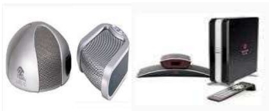
Оборудование для видеоконференцсвязи (ВКС)

обратную связь с методическими службами, различными органами власти, родителями и другими дошкольными образовательными учреждениями с целью организации совместной работы и распространения опыта. Комплекс дает возможность использования интерактивных вариантов взаимодействия (видеоконференция, профессиональное общение, открытые игровые занятия, передача файлов и голосование и т.д.).